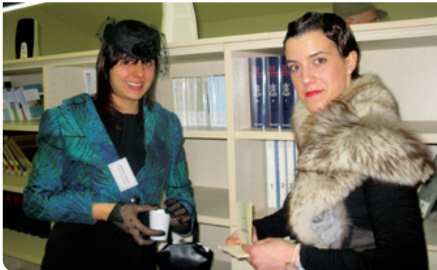
Buffet con delitto in biblioteca

Queste le premesse del “murder party” che si è svolto in biblioteca venerdì 18 maggio , un gioco di indagine i cui partecipanti sono diventati, per alcune ore, cittadini di Fawksville, chi impersonando lo scrittore Mark Landwood, chi il sindaco, la fotografa, il medico e così via. A ognuno dei protagonisti, qualche giorno prima dell'evento, era stata